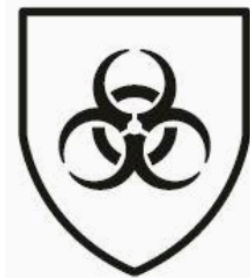
ISO 374-5: 2016